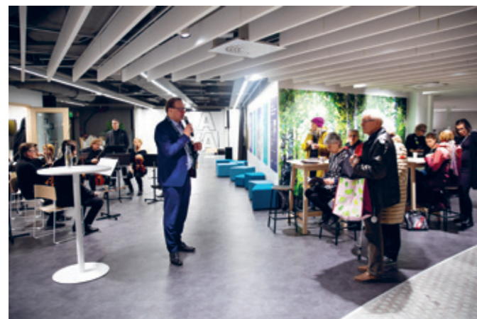
Vuoden 2019 aikana rakennettu palvelutori avattiin kauppa- ja palvelukeskus Triossa tammikuussa 2020.

Tarkastuslautakunta toteaa, että palvelutorille on ollut tilausta ja kaupunkilaiset ovat ottaneet sen omakseen heti avaamisesta alkaen. Lautakunta toivoo, että aiemmin kauppa- ja palvelukeskuksessa toiminut ja kaupunkilaisia hyvin palvelut terveyskioski matalan kynnyksen palvelupisteinä voitaisiin palauttaa toimintaan palvelutorin jatkokokeittelussa. Nykyinen terveysneuvontapiste ei toiminnoiltaan vastaa aiempaa terveyskioskia.