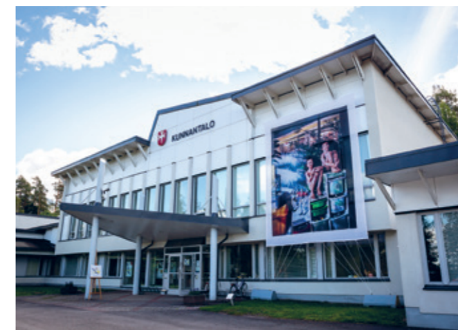
Nastolan kunnantalon kesänäyttely 2019.

Tarkastuslautakunta toteaa, että yhdistymisavustuksen käyttötarkoitus on ollut väljä. Tämä on mahdollistanut avustuksen monenlaisen käytön etenkin, kun avustuksen käytöstä ei ole ollut selkeää suunnitelmaa.