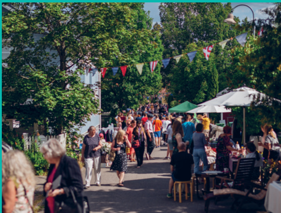
Päijät-Hämeen vuoden kyläksi 2020 valittiin Anttilanmäki. Alueella toimii ja vaikuttaa aktiivinen Anttilanmäki-Kittelän asukasyhdistys ry. Kuva Anttilanmäen kyläjuhlista.