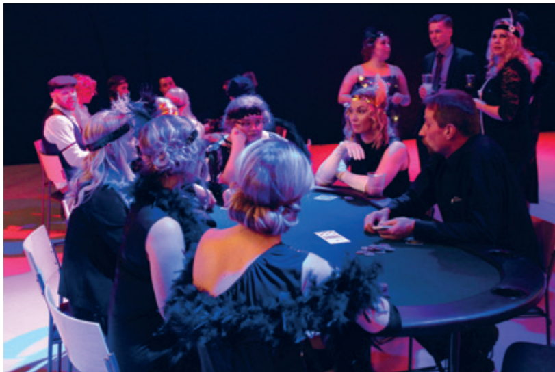
Kaupungin työntekijöiden yhteiset pikkujoulujuhlat "Lahen bileet" järjestettiin toista kertaa 5.12.2019

Henkilöstöasiat olivat tarkastuslautakunnan arviointikokouksen aiheena joulukuussa 2019. Tällöin henkilöstöjohto kertoi tavoitteena olevan, että Lahden kaupungista tehdään Suomen paras työpaikka. Lautakunnan mielestä tähän on vielä pitkä matka. Esimiestyössä, henkilöstön palkkaustavoissa, urakehitysmahdollisuuksissa, palkitsemisessa ja sijaisjärjestelyissä on vielä paljon kehitettävää.